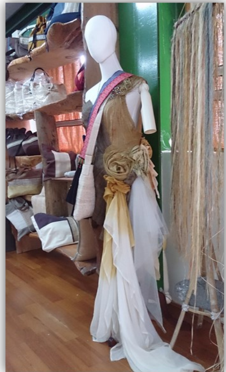
以香蕉絲編織而成的各項手工藝品