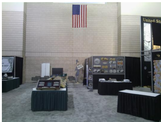
美國造幣廠展位二