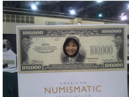
兒童活動區－紙鈔頭像置換