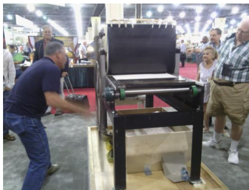
美國印鈔局表演凹版印刷