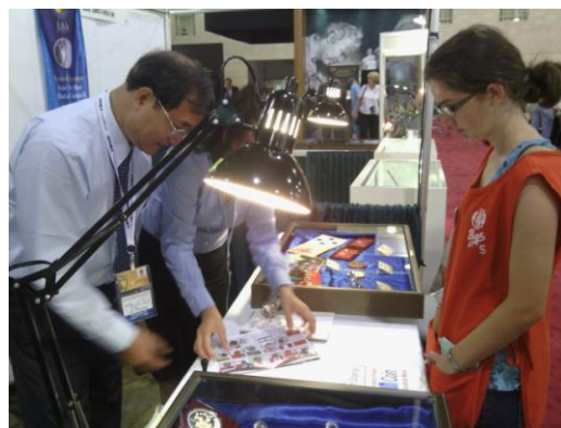
工讀生代為收集世界錢幣