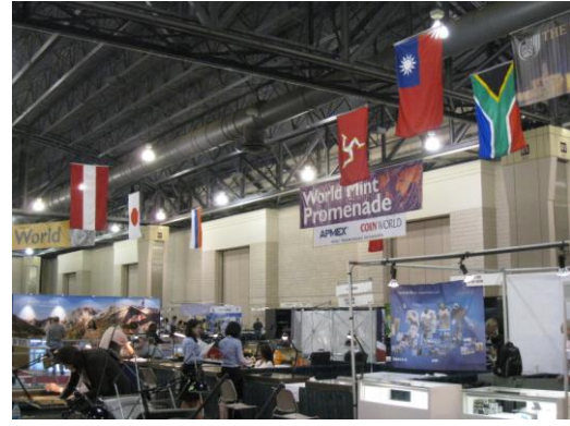
各國造幣廠展位區二