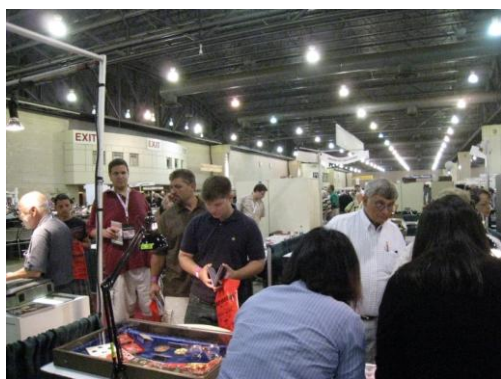
民眾排隊索取流通幣及蓋紀念戳章