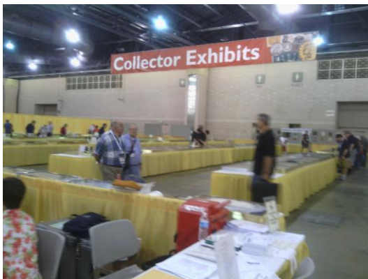
錢幣收集者展覽區