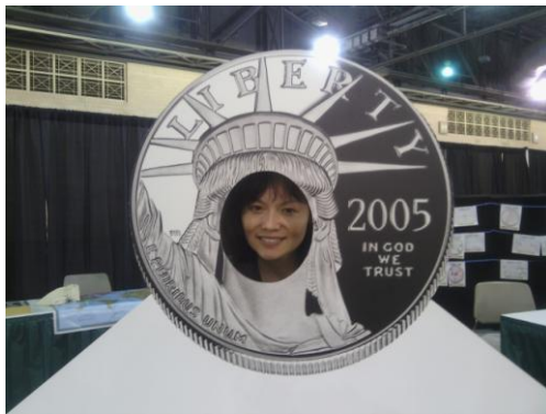
兒童活動區－紀念幣頭像置換