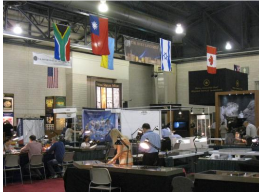
各國造幣廠展位區一