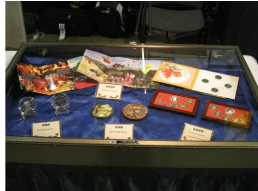
中央造幣廠展品二