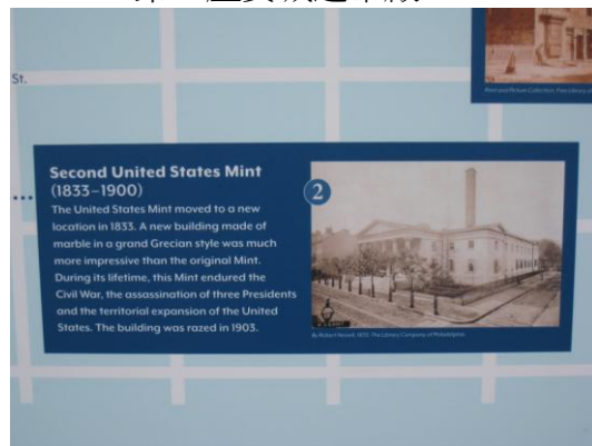
第二座費城造幣廠