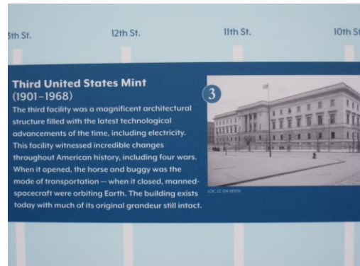
第三座費城造幣廠