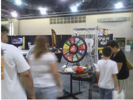
兒童活動區－轉輪活動