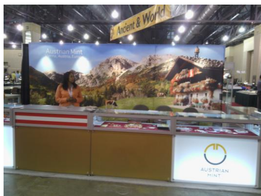
奧地利造幣廠展位