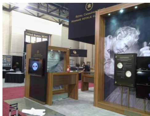
加拿大造幣廠展位