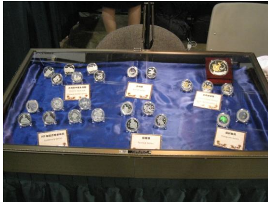
中央造幣廠展品一