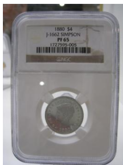
含鑑定標誌之壓克力包裝盒