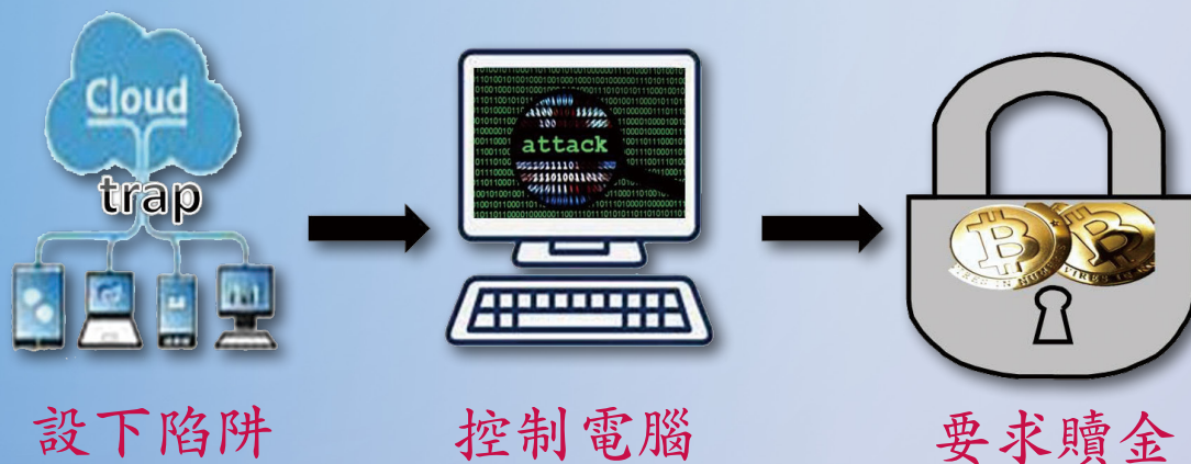
圖 1 勒索軟體攻擊三階段

基本上勒索軟體攻擊主要有三個階段，如圖 1 所示，駭客會先設置惡意陷阱以潛入用戶電腦，俟偵測出用戶系統漏洞，匿名資料夾即自動執行取代原資料夾，將所有檔案加密，並出現要求支付贖金的通知訊息，用戶支付後才能取回檔案。