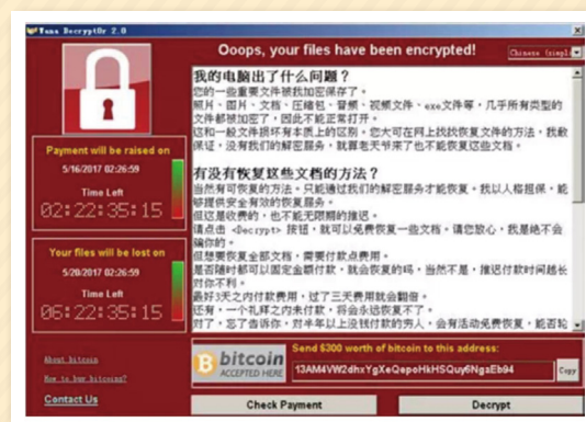
圖 2 勒索訊息

當勒索軟體完成檔案加密後，使用者登入系統或開啟檔案時，就會跳出勒索通知如圖 2，要求期限內支付相當金額的比特幣，如果超過期限贖金則加倍，唯有支付贖金以取得私鑰（private key）回復檔案。